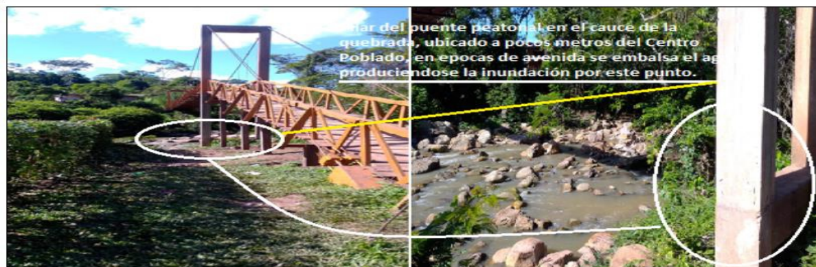
Figura N°02.- Se aprecia que los pilares del puente se encuentran dentro del cauce de la quebrada, en épocas de creciente estos pueden erosionar por la velocidad del agua, debido a que se encuentran desprotegidos pudiendo provocar el colapso del mismo. También vemos que el desnivel de la parte urbana es bajo con respecto al cauce de la quebrada por lo que es un punto crítico de inundación, por lo que es necesario plantear actividades de descolmatación y colocación de rocas al volteo.