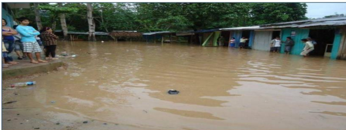
Figura N°03.- Se visualiza viviendas afectadas por el desborde de la quebrada Sacanche en años anteriores, los que ocasionaron pérdidas en la economía de los habitantes del CP Víctor Raúl.